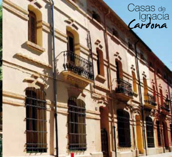
Casas de Ignacia Cardona