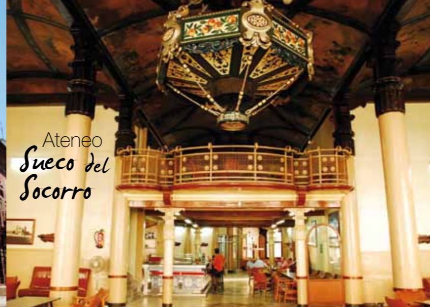
Ateneo Sueco del Socorro